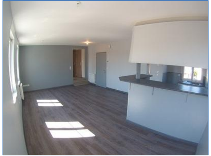
Pièce à vivre